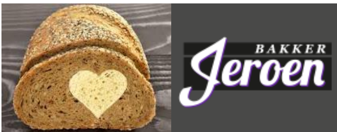
Zoutarm brood: 'goed te doen, hoor'

“Ik ben zoutarm volkorenbrood gaan eten, maar ik ben de enige hier op de dialyse-afdeling. Zout/natrium is van grote invloed op je bloeddruk en een groot probleem voor dialysepatiënten. Waarom het hier niet gegeten wordt is voor mij een raadsel. Niemand lust dat kennelijk. Ik wel, het smaakt prima. Iedere bakker kan het op bestelling leveren.